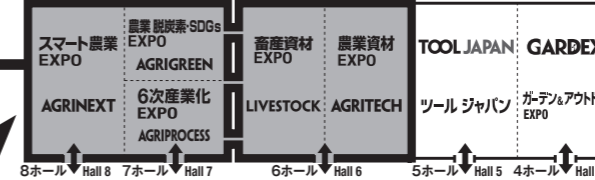
全体レイアウト図 Floor Plan

■ 会期：2023年10月11日[水]～13日[金] Dates : October 11 [Wed] – 13 [Fri], 2023 ■ 会場：幕張メッセ Venue : Makuhari Messe ■ 主催：RX Japan 株式会社 Organizer : RX Japan Ltd.